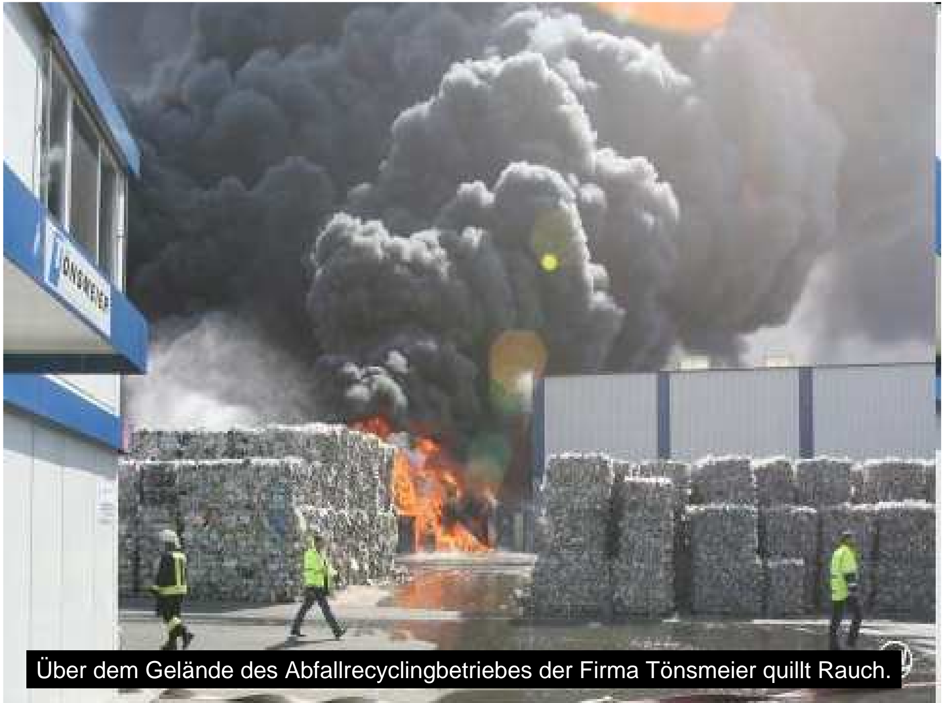
Über dem Gelände des Abfallrecyclingbetriebes der Firma Tönsmeier quillt Rauch.