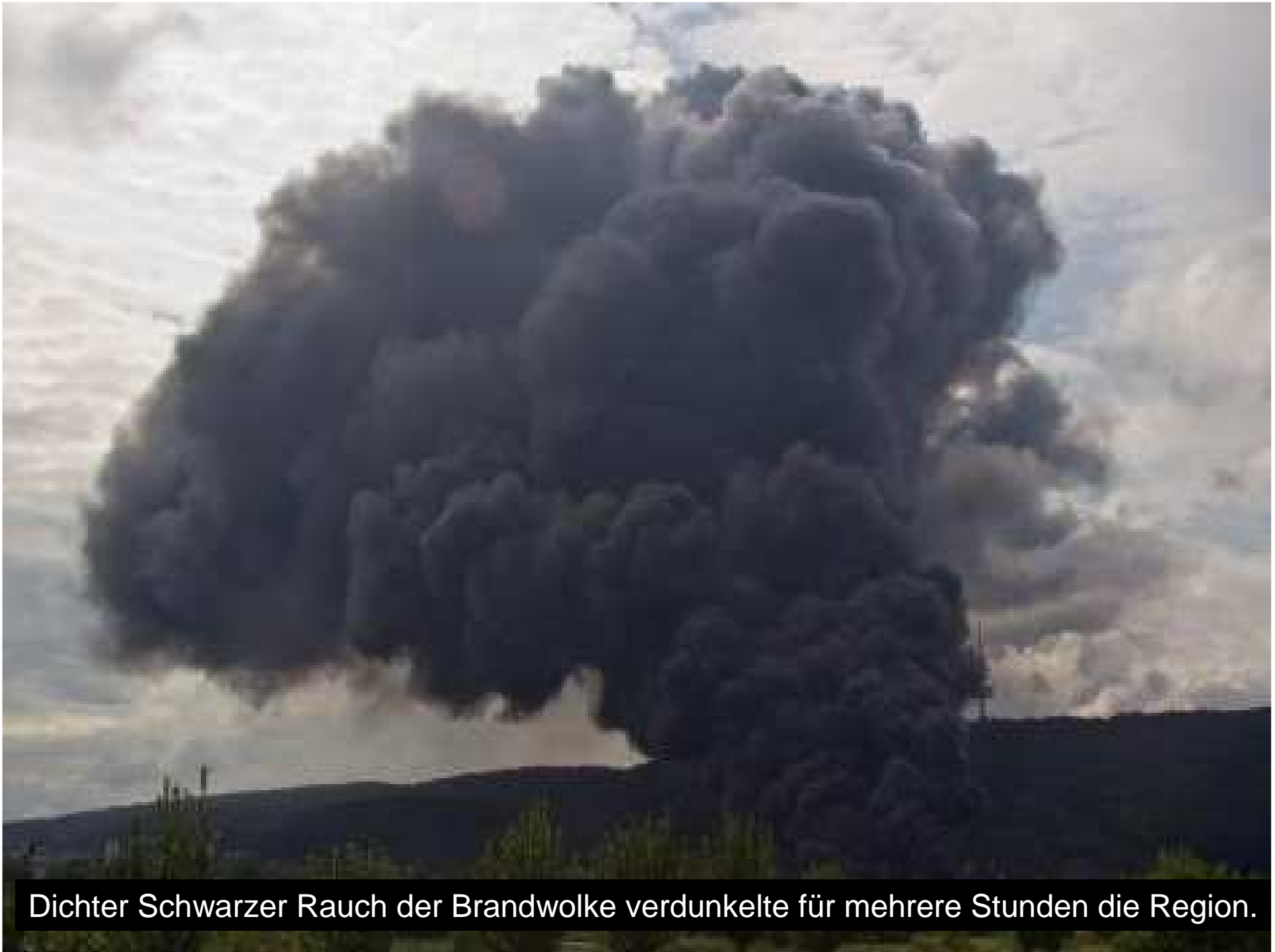
Dichter Schwarzer Rauch der Brandwolke verdunkelte für mehrere Stunden die Region.